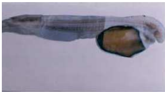
Gambar 2 Larva Ikan Senggaringan baru menetas