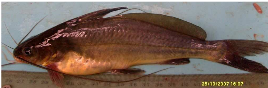
Gambar 1 Ikan Senggaringan ( Mystus nigriceps )